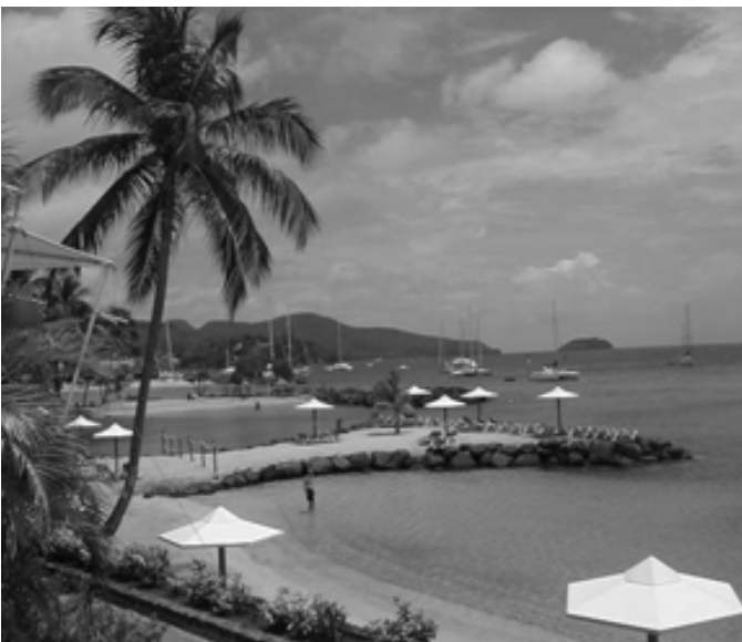
La plage à la Pointe-du-Bout

En somme, tout était fait pour plaire aux congressistes—une cuisine délicieuse et abondante, un cadre magnifique avec vue sur la mer à l'ombre des palmiers, des hôtels de premier ordre et un accueil partout chaleureux. On pouvait voir au fil des jours la décontraction des participants qui sont devenus de plus en plus souriants, de moins en moins stressés et dont les habits de vacances prévalaient sur la tenue de ville. Les sacs, jupes, chemises et autres articles en madras apparaissaient davantage chaque jour. Il est évident que beaucoup de professeurs se sont procurés de quoi décorer leur salle de classe et de quoi illustrer de nombreuses leçons sur la Martinique. Nous sommes sûrs que tous ceux qui ont eu la chance d'assister à ce congrès inoubliable pensent déjà à retourner à l'île aux fleurs.