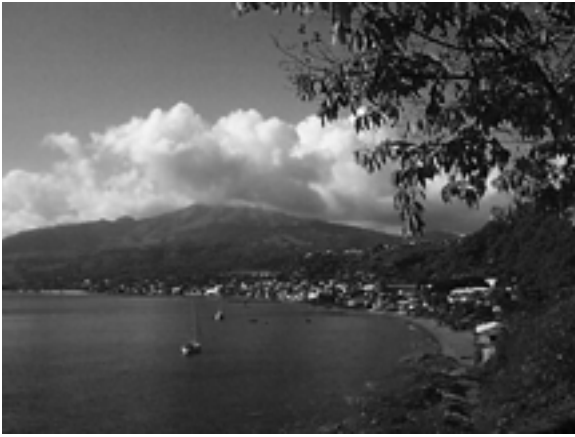
La Montagne Pelée et la baie de St. Pierre

sérieux des congressistes qui cherchaient à profiter non seulement du lieu mais du contenu professionnel du programme.