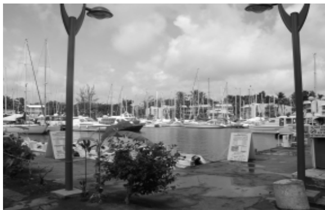
La Marina à la Pointe-du Bout

Les 5, 6 et 7 juillet, le programme était au complet avec plus de 115 sessions données par 166 intervenants, dont parmi eux de nombreux invités martiniquais, belge, québécois et canadiens. Un va-et-vient perpétuel entre les trois hôtels (le Kalenda, le Bakoua et le Carayou) où se déroulaient les séances attestait preuve du