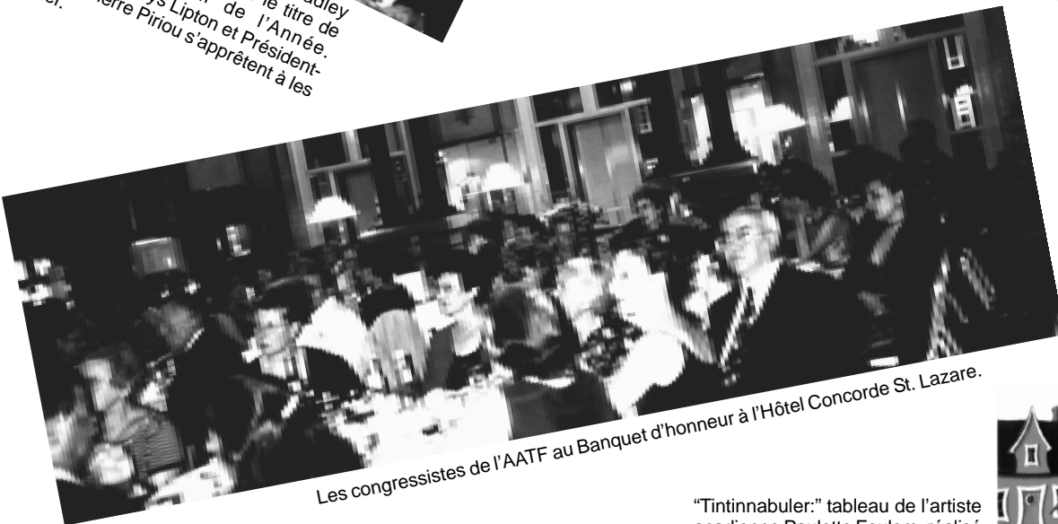
Les congressistes de l'AATF au Banquet d'honneur à l'Hôtel Concorde St. Lazare.